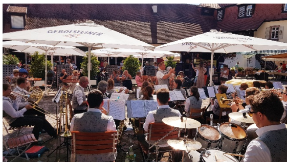
Naturparktag im Schloss Neuweier

Auch ein toller Event bei herrlichem Wetter im Schlosshof in Neuweier, der Naturparktag, der in Zusammenarbeit zwischen dem Weingut Schätzle und dem Naturpark Schwarzwald-Nord ausgerichtet wurde.