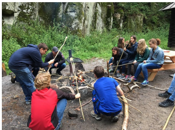
Unsere Jungmusiker im Steinbruch

Ansonsten war das Jahr 2017 geprägt durch allerlei Kameradschaftliche, als auch