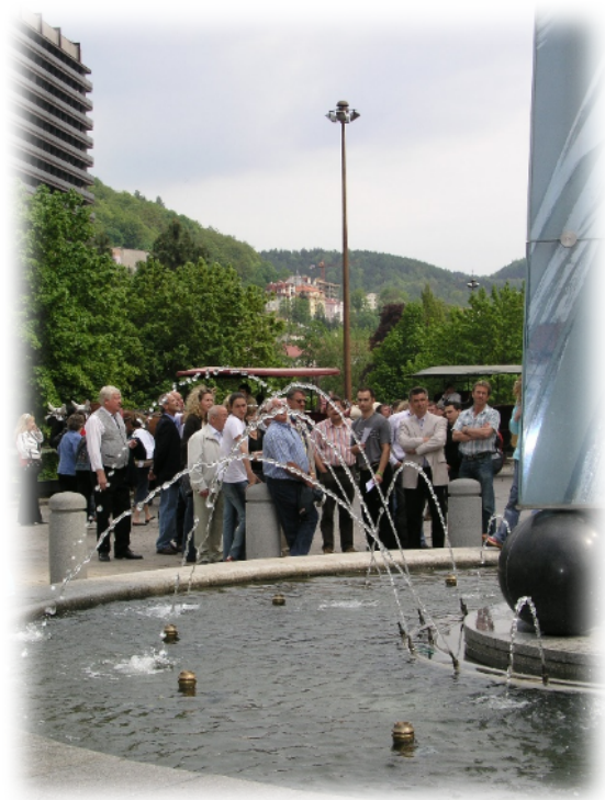
Eindrücke aus Karlsbad