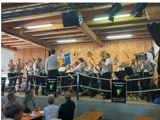
In der Fentes-Scheune

Original-Egerländer-Musikanten von Ernst Hutter übernimmt. Zum zweitenmal nach 2018 kombinierten wir einen Vereinsausflug mit einem Auftritt im Allgäu.