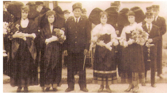
Das erste Treffen im Elsass