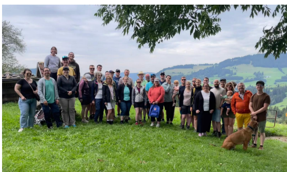
Auf der Pfarralpe

Das Walkartsfest in Waltenhofen im Allgäu war unser Ziel, wo die Fentes-Kapelle ihr 40-jähriges Jubiläum feierte. Unser musikalischer Beitrag war die Mitgestaltung des Gottesdienstes am Sonntag durch ein Sextett aus unseren Reihen, sowie das anschließende