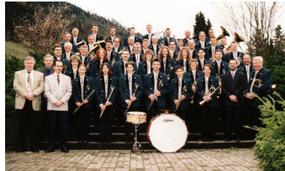
Die Musikkapelle im Jubiläumsjahr

Musikkapelle beim Festakt zum 100-jährigen Bestehen im Jahr 2000 vor.