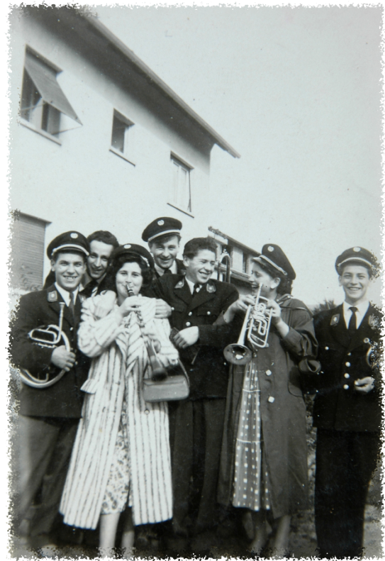
Musik machen ist doch schön...

Die Freundschaft wurde in den vergangenen 37 Jahren unentwegt gepflegt. Jährlich besuchen wir uns gegenseitig zu den Konzerten und Festen und es sind immer wieder besonders schöne Stunden, die wir miteinander erleben. Wenn wir mit dem Bus ins Elsass fahren, kommen wir selten zur geplanten Uhrzeit nach Hause.