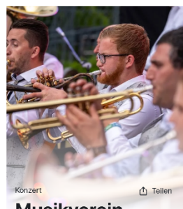
Konzert Musikverein Neuweier e.V. | Christkindelsmarkt

Leistungsabzeichen (Junior-JMLA). Die Junior-Abzeichen 1 und 2 sind der behutsame Einstieg in die Themenvielfalt der Jungmusiker-Leistungsabzeichen und somit Fundament für die Leistungsstufen Bronze, Silber und Gold. Hier sammeln junge Musizierende ihre ersten Erfahrungen – ganz ohne Leistungsdruck.