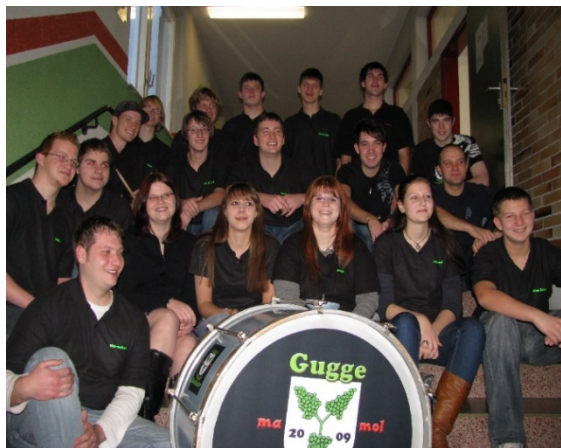
Die neu-formierte "Gugge-ma-mol-Mussi Neuweier"

neue Gruppierung aus dem Gesamtorchester heraus, zur "Gugge-ma-mol-Mussi Neuweier". Mit schrägen Tönen, lautem Schlagwerk und viel Begeisterung bereichern die närrischen Musikerinnen und Musiker die Fastnachtsszene in Neuweier, dem Baden-Badener Rebland und der weiteren Region.