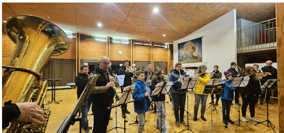
Aufspielen zu St. Martin im Michaelsheim

Zur Advent- und Weihnachtszeit werden unsere Aktivitäten wieder umfangreicher. Mit der St. Martinsfeier zusammen mit den Kindergarten- und Schulkindern beginnt es und findet ein Ende mit dem Weihnachts- und Gedenkgottesdienst in der St. Michaelskirche.